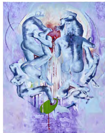
Bruno Perramant, Blue asses (Les culs bleus) , 2020

43 RUE DE LA COMMUNE DE PARIS 93230 ROMAINVILLE FRANCE T +33 (0)1 53 79 06 12 GALERIE@INSITUPARIS.FR WWW.INSITUPARIS.FR