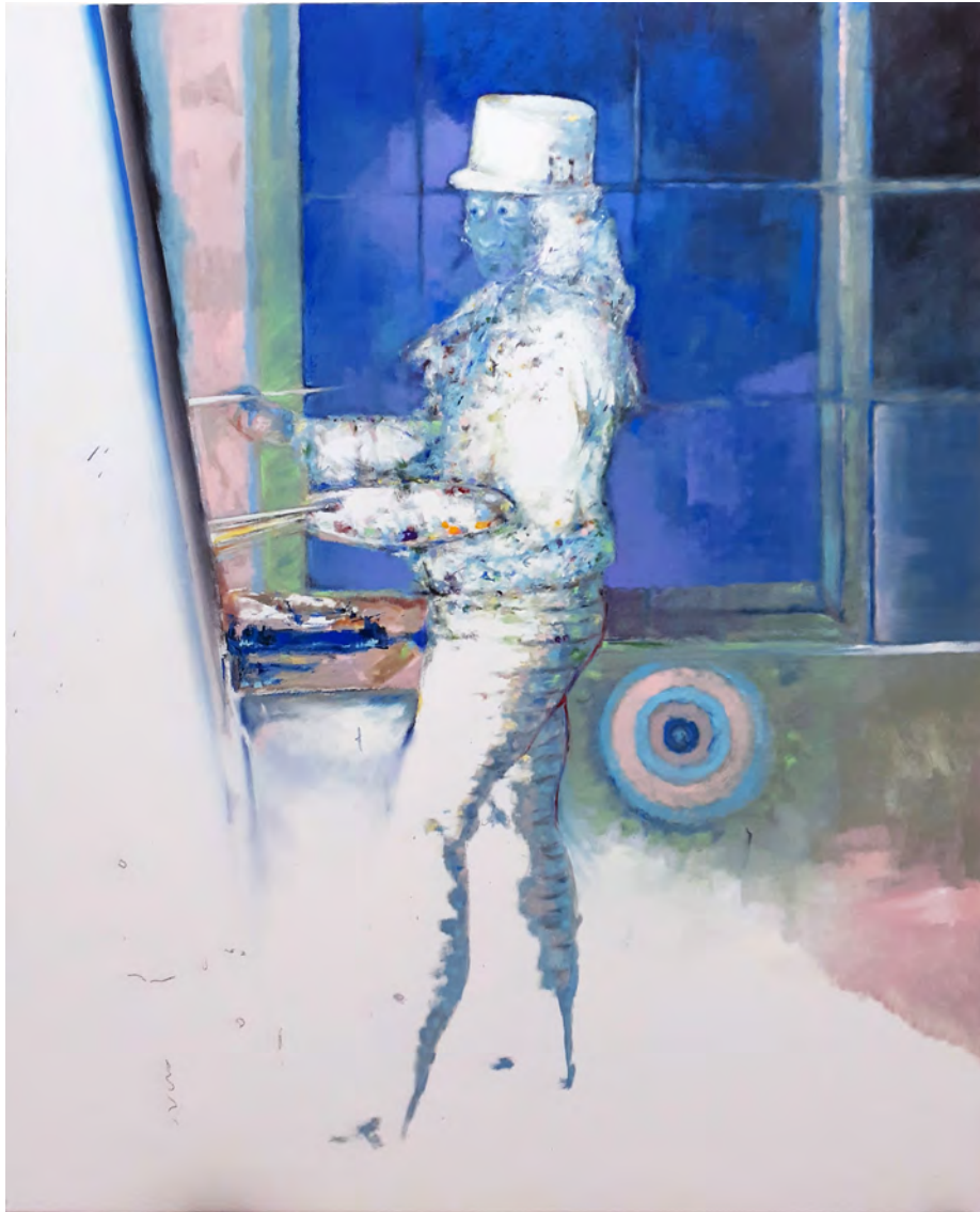
Goya bleu, 2021