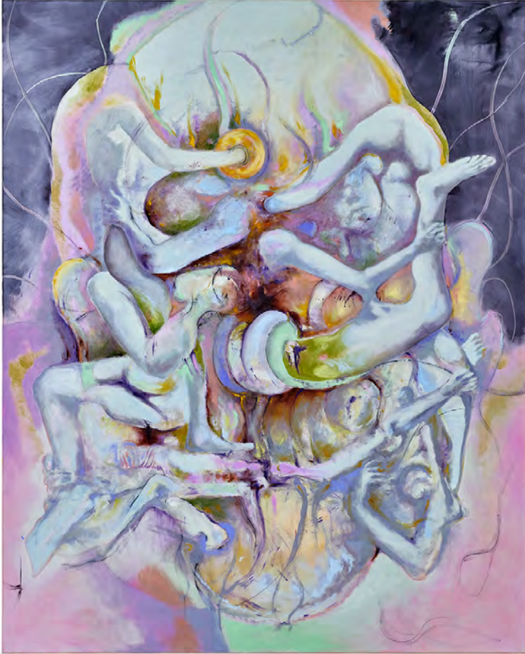
Pierre Guyotat portrait , 2020