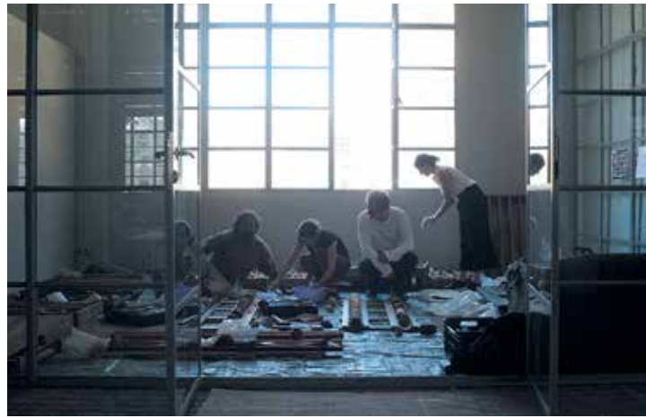
Beyrouth / Beirut