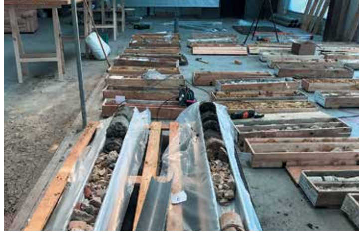
Paris / Paris