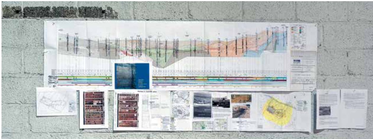
▲ Recherche archéologique et géologique, Monasteraki, Athènes / Archaeologic and geological researches, Monasteraki, Athens