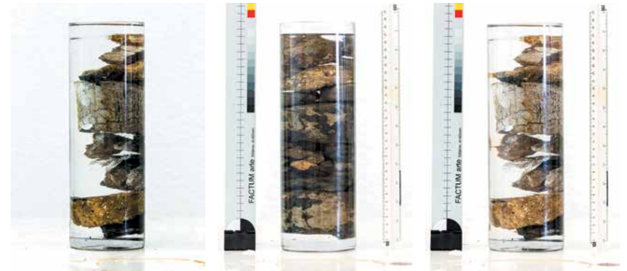
Carotte : Collège de France, Musée de Cluny [Paris] / Core: Collège de France, Cluny Museum (Paris) ▼