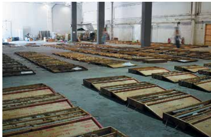
Athènes / Athens